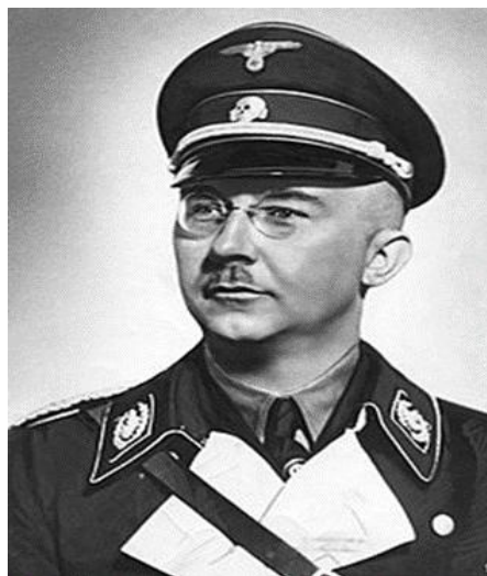
Heinrich Himmler. Reichsführer de las Schtzstaffel (jefe Superior de las SS).