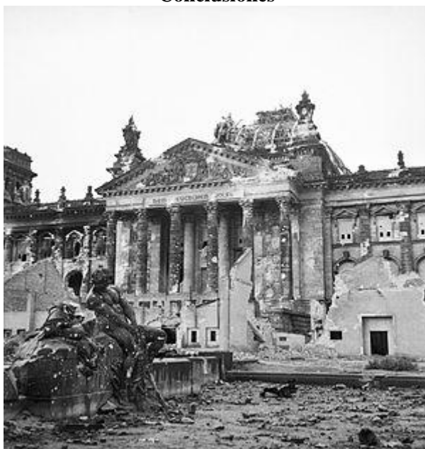
El Reichstag después de la batalla de Berlín