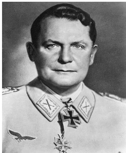
Hermann Goering. Comandante en jefe de la Luftwaffe

La experiencia en el coto de caza de propiedad de Göring en Schorfheide fue un desastre. La ensoñación delirante del zoólogo, empapada definitivamente por el ideario nazi, produjo finalmente animales monstruosos, causando terror y destrucción. Los toros de Heck resultaron ser muy agresivos y atacaban a los lugareños sin mediar provocación alguna. También invadieron el espacio que ocupaban los ciervos quitándoles su alimento. Goering, enfurecido con la situación, prohibió el ingreso de más toros salvajes a su propiedad, aunque siguieron provocándole dolores de cabeza, los que allí habían quedado, libres en el bosque.