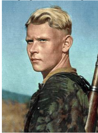
Exponente de la raza aria

investigador Lecouteux (1995). En ese contexto, la jerarquía nazi aprueba un programa denominado "uro reconstituido". Como consecuencia de esta acción político/ideológica, Lutz Heck recibe el financiamiento necesario y pone sus investigaciones al servicio del régimen nazi. Entusiasmado con los recursos frescos recibidos, da a conocer un programa de trabajo, que excede los marcos de una investigación científica, haciendo una descripción casi poética de los bosques alemanes, poblados por megaherbívoros poderosos y salvajes, cazados por los guerreros arios, la nueva raza que produciría el régimen liderado por Hitler.