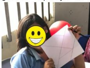
Figura 23 – Aplicação do Tangram