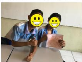
Figura 19 – Aplicação do Tangram