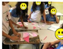
Figura 20 – Aplicação do Tangram