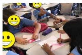
Figura 22 – Aplicação do Tangram