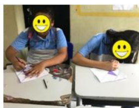
Figura 24 – Aplicação do Tangram