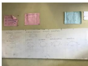
Figura 9 – Atividade de Figuras Planas