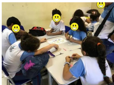
Figura 3 – Aplicação do jogo Cubra 12