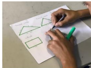
Fonte: Registros fotográficos da pesquisa Figura 10 – Atividade de Figuras Planas