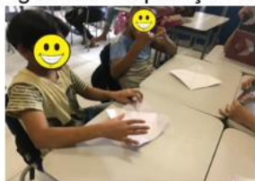
Figura 21 – Aplicação do Tangram