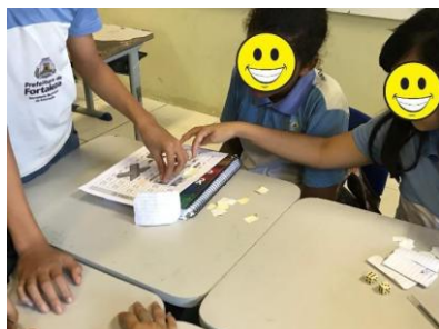
Figura 5 – Aplicação do jogo Cubra 12