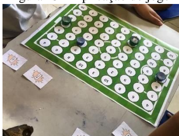
Figura 13 – Aplicação do jogo Divibol