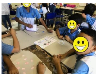
Figura 1 – Aplicação do jogo Cubra 12